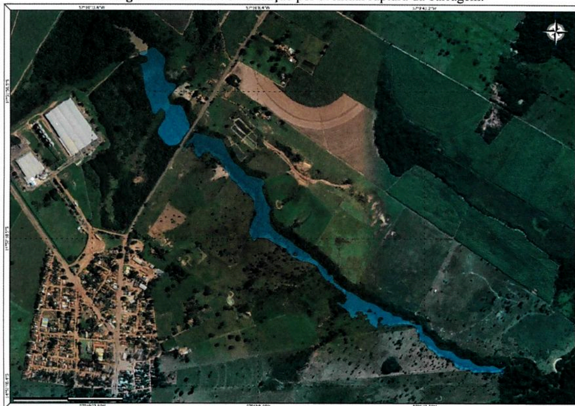
Figura 1: Mancha de inundação por eventual ruptura da barragem.

Conforme relatado pelo responsável técnico sobre a mancha de inundação da barragem (figura 1), foi identificado um polígono com área de 14,47 hectares que provavelmente seria inundado em caso de um hipotético rompimento da barragem, seguindo a metodologia simplificada recomendada pela Agência Nacional de Águas (ANA). Neste cenário, é importante destacar que o possível rompimento não afetará quaisquer edificações a jusante. No entanto, a rodovia estadual MT-343 está localizada na área afetada. Felizmente, a elevação da rodovia está acima da cota de inundação, o que significa que não haveria galgamento da infraestrutura. No entanto, é válido ressaltar que ocorrerá um impacto devido à ruptura do barramento, o que pode afetar a rodovia e seu funcionamento (Fls. 212).